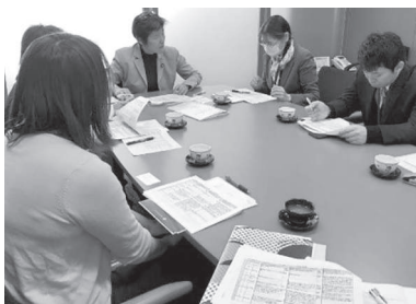
参議院議員会館 1021号室で 倉林明子議員と

生活保護は、命を守る大切なセーフティネットであり人権です。「引き下げ」という形で人権侵害されてしまうのは、果たして国民のための政治と言えるのでしょうか？「一緒に戦いましょう」「まだまだ諦めていない」という国会議員の言葉を強く胸に刻み、引き続き声を上げ続けていきたいと思えます。