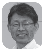
健康づくり推進委員会を立ち上げ、旺盛な健康づくり活動を展開してきました。