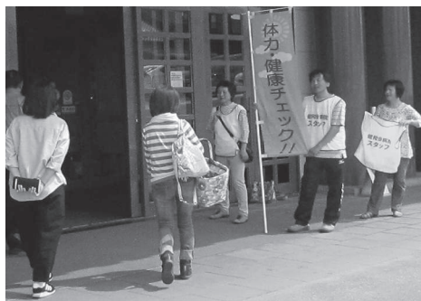
健康チェックの勧め