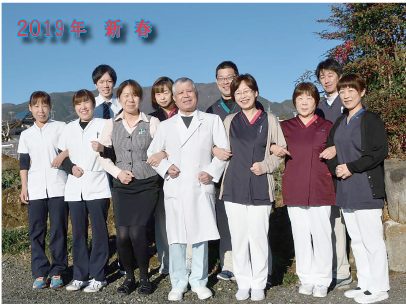
かやの木診療所の仲間たちと朝の光を浴びて