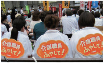
国民集会 介護職員を増やして 2013年5月号に掲載された満蒙開拓平和記念館の記事を読んだこと

を契機に、満蒙開拓に関心をもち「ピースJap.」ボランティア活動に参加。2016年8～9月の飯田日中協会訪中派遣に参加。満蒙開拓体験談をどのように伝えていくか、聞いた人の責任がある。