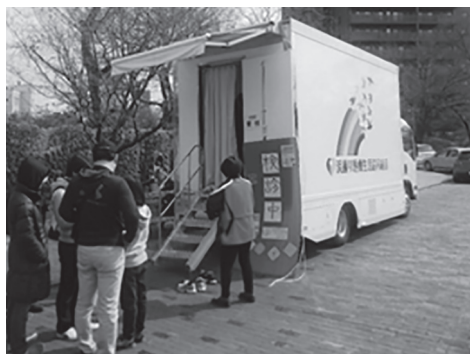
クリーニングできるゲート式被爆放射線量モニタリング測定器を搭載した車両

2017年、いわきから群馬に避難している丹治さんから、浜通り医療生協が所有する「FT F*検診車」が空