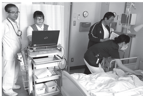
チームによる病室へのケア巡回

認知症を有する患者さんは、時にご自分の具合や痛みについて正確に表現することが困難になることがあります。そして、気がつかないうちに入院生活の影響を受け、変調をきたしている場合もあります。認知症ケアチームにリハビリ職種が参加することで、リハビリの視点から体の動きや状態をみて具合を察