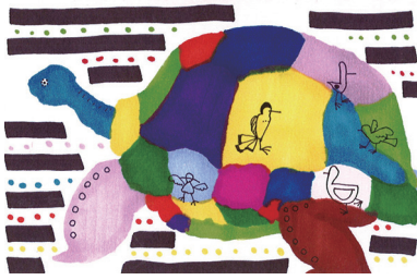
イラスト・村松 希 「私はかめ スロースターター」

今春、救急搬送され、約半月入院。担当してくださった看護師、検査技師、手術室、栄養科、リハビリ、薬剤師等