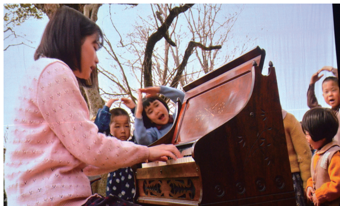
映画「あの日のオルガン」

10日(土) 午前中、「ヤング・ピースコンサート」と「松元ヒロさんの公演」を開催。