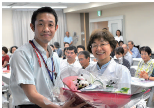
当院織野事務長から花束贈呈