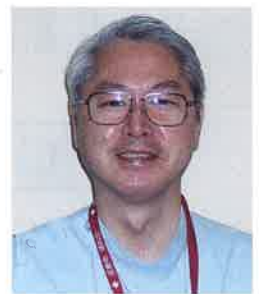
健和会飯田中央診療所

最近、ドイツが10年前に社会の安定した存続の条件を分析して、3つの分野に強化策を絞り込み長期的な対策を講じてきたことが報道されました。その一つが「未知なる感染症の蔓延に対して、急性期病床を増やす」ことでした。10年後ドイツは新型コロナウイルスに襲われましたが、隣国のフランスから重症患者を引き受けるほどドイツでは急性期病床が整備されていました。日本とドイツの国の在り方の違いに驚嘆します。