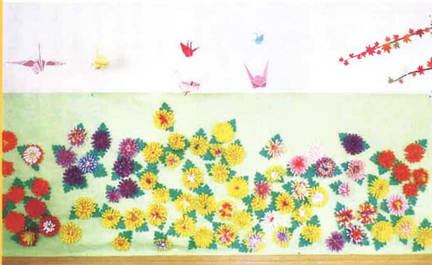
林の杜 デイケア作品